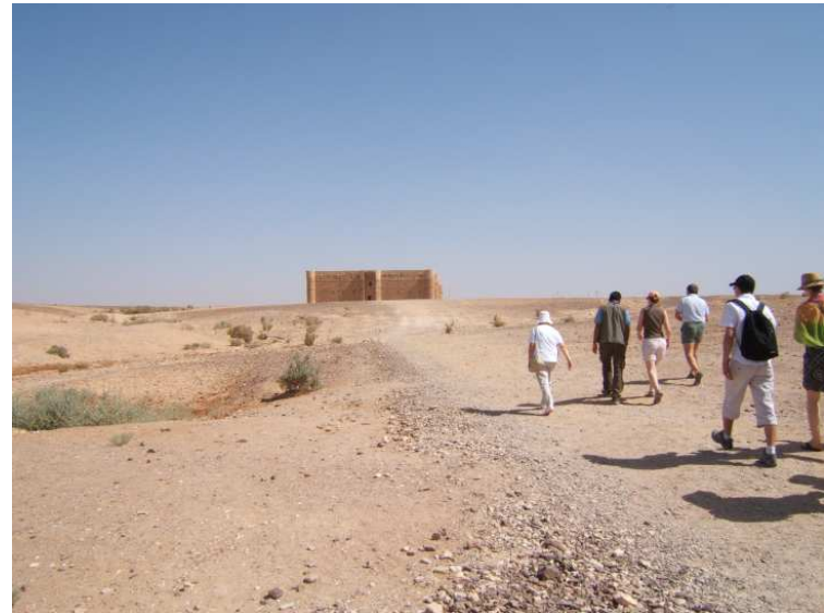
Les châteaux du désert