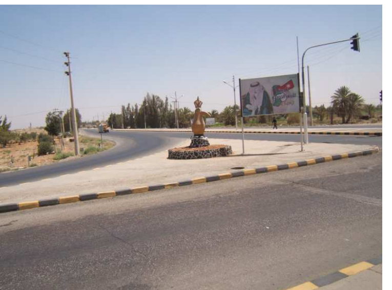
A chaque entrée, une cafetière en bienvenue