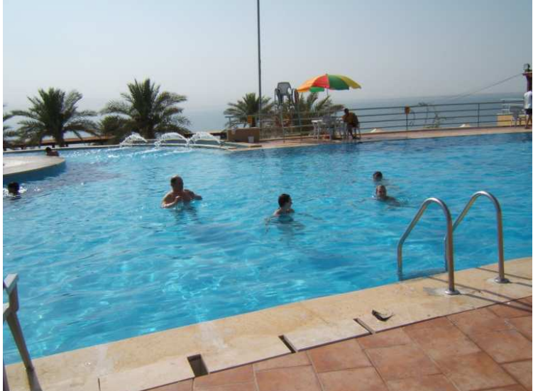
et les plaisirs de la piscine.