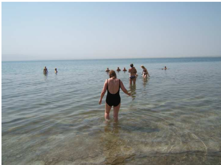
et on entre dans la Mer Morte (35% de sel)