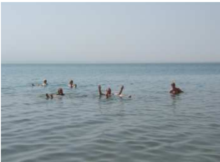
On y flotte comme un œuf dans la saumure...